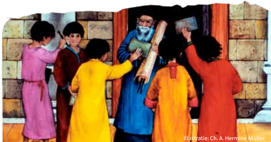
Illustratie: Ch. A. Hermine Müller