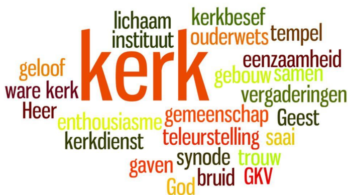
Afb. 1. Voorbeeld van een woordweb over de kerk

Als u de beschikking hebt over laptops of tablets kan het woordweb ook heel mooi online gemaakt worden, bijvoorbeeld via de site www.woordwolk.nl Geef de woordwebben een mooi plaatsje in het verenigingsgebouw.